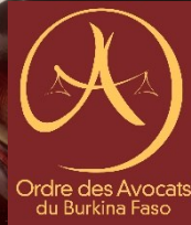
TABLEAU DE L'ORDRE DES AVOCATS ET LISTE DE STAGE

BARREAU DU BURKINA FASO 01 BP 1773 Ouagadougou 01 Tél. : 25 30 22 90/ 72 22 86 63 – Fax : 25 30 23 09 E-mail : info@barreau.bf